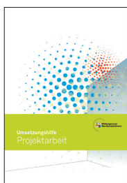
Handreichung Abschluss- zertifikat und Umsetzungshilfe Projektarbeit

In der 3. Klasse der Sekundarstufe I 1 realisieren die Schülerinnen und Schüler der Kantone Aargau 2 , Basel-Landschaft, Basel-Stadt und Solothurn eine Projektarbeit. Mit der Projektarbeit zeigen die Jugendlichen ihre Fähigkeit, sich über eine längere Zeit hinweg in ein Thema zu vertiefen und es eigenständig zu erarbeiten. Überfachliche Kompetenzen wie Selbstständigkeit, Kooperation, Planung und Problemlösefähigkeit werden geschult, reflektiert und dokumentiert.